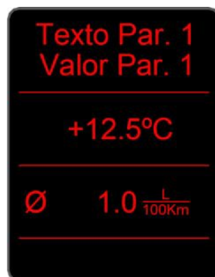
Pantalla 1 parámetro

En caso de visualizar 2 parámetros, se mostrarán únicamente los valores de los parámetros, siendo la línea superior el valor del parámetro 1, y la línea inferior, el valor del parámetro 2.