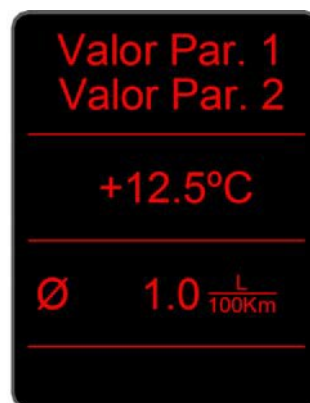
Pantalla 2 parámetros