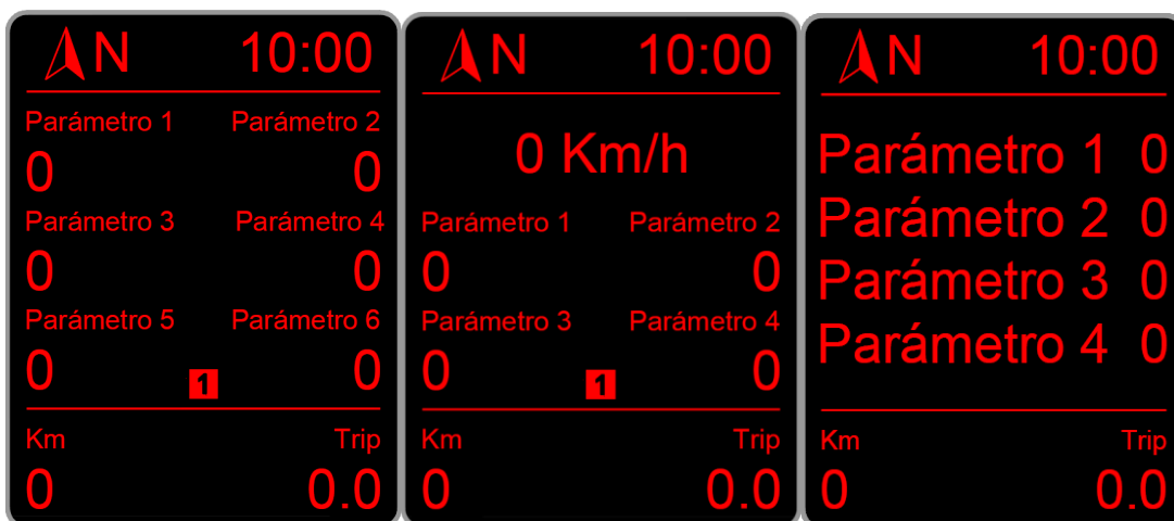
Configuración 6 parámetros

Por último, se puede modificar la representación del escritorio en pantalla, para mostrar 4, 5 o 6 parámetros, las configuraciones serían las siguientes: